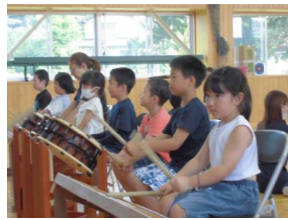
「沼田祇園囃子教室 7/2」